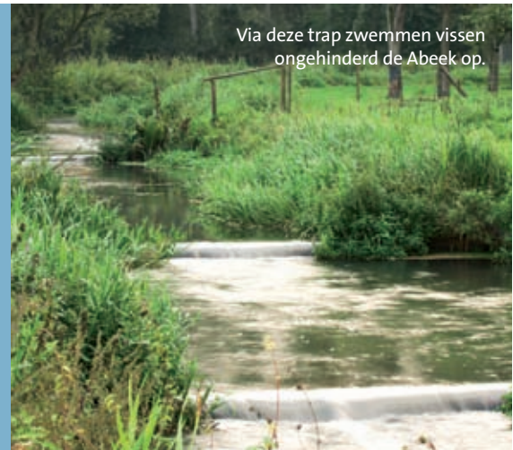
Via deze trap zwemmen vissen ongehinderd de Abeek op.

In Noordoost-Limburg is water koning. Een web van grote en kleine beken en grachten doorkruist de regio. De Abeek moet wel één van de puurste beken van Vlaanderen zijn. Ze heeft een rijke libellenpopulatie op haar conto staan en voldoet zelfs aan de hoge waterkwaliteitseisen van beekprik en serpeling, twee Europees beschermde vissoorten. De nieuw aangelegde vistrappen helpen de vissen om obstakels in de beek te overwinnen. Op die manier kunnen ze op zoek naar geschikte paar- en rustplaatsen. Door ingrepen in het verleden is de Abeek zijn natuurlijke bochten en oevers kwijt. Door diverse herstelprojecten kreeg de beek opnieuw ruimte om te stromen. De natte natuur kan zich hier weer tomeloos ontwikkelen.