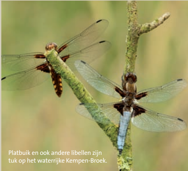
Platbuik en ook andere libellen zijn tuk op het waterrijke Kempen-Broek.

Het Grenspark Kempen~Broek aan de noordostrand van het Kempens plateau strekt zich uit over de grens met Nederland. Het is een moerasachtig gebied, waar enkele zandruggen bovengruut steken. Eeuwen geleden was dit het actierrein van smokkelaars en bokkenrijders, vandaag het honk van watersnuffels, platbuiken en viervlekjes. Herstelprojecten toerden de deelgebieden Smeethof en de Luysen om tot natuur met een grote N. Metingen toonden onlangs aan dat het Kempen-Broek voldoet aan alle normen van een stiltegebied. Als eerste in Vlaanderen kreeg het een stilte-label met drie sterren voor een periode van vijf jaar. Vanaf deze zomer kan je er onder begeleiding van een gids mee op stiltewandeling. www.rlkm.be