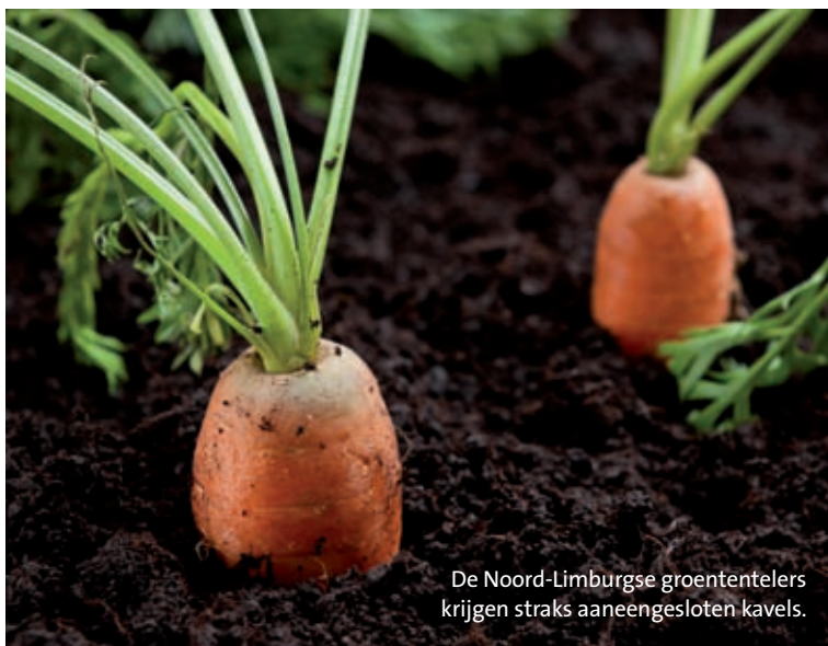
De Noord-Limburgse groententelers krijgen straks aaneengesloten kavels.